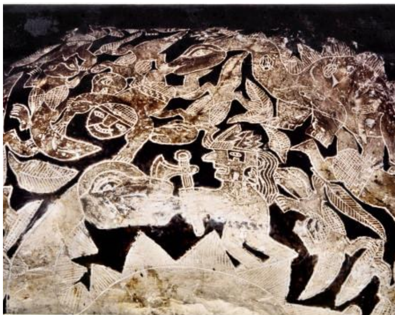
PIEDRA DEL MENSAJE DE LAS 12 HEBRAS DE ADN

También me comentó que hacían uso de una careta como la que vemos en los grabados para cazar los dinosaurios, pues los convertía en invisibles a sus ojos.