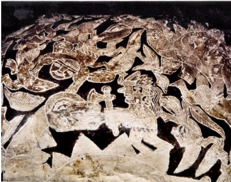
PIEDRA DEL MENSAJE DE LAS 12 HEBRAS DE ADN

También me comentó que hacían uso de una careta, como la que vemos en el grabado, para cazar los dinosaurios, pues los hacía invisibles a sus ojos.