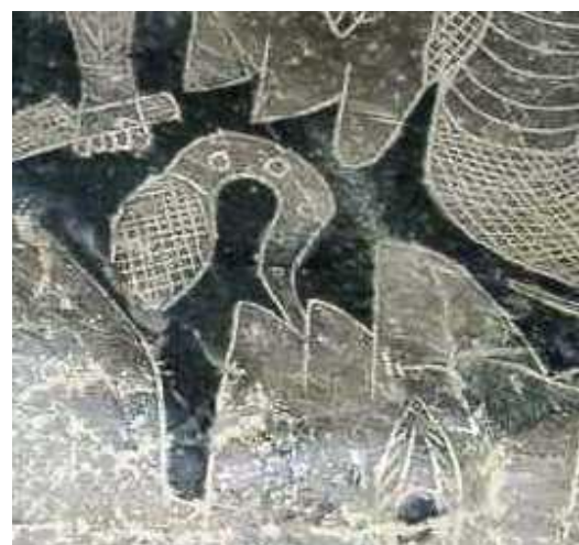
DETALLE CAMBIO DE BIOLOGIA SERPIENTE POR DRACONIANA

Los cambios biológicos de la Humanidad y los Planetas elegidos para las experiencias genéticas, están grabados en las Piedras de Ica, así como diferentes mutaciones en tránsito hacia nuestra forma actual, por ello, después de múltiples experiencias, en las que hubo todo tipo de formas físicas, con extrañas mezclas biológicas entre animales, humanos e incluso plantas, bien por Guerras Cósmicas o Imposiciones de Consejos o Federaciones Galácticas , se optó por la destrucción de toda forma de vida en el Planeta, varias veces, para el “borrando” e inicio de nuevas experiencias genéticas, modificando nuestra biología con otras variantes distintas de