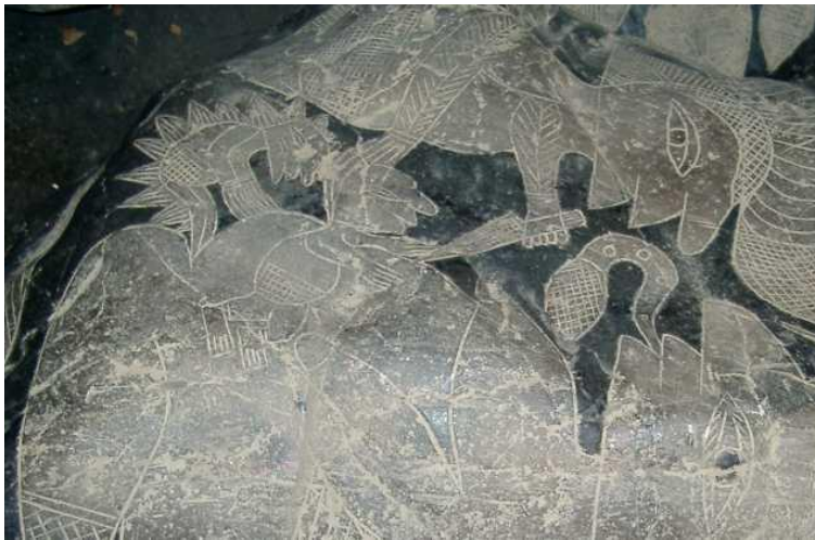
Ver Piedra completa en la Web -detalle Cesáreas –