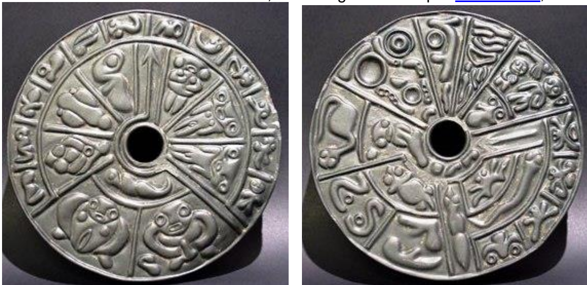
COPIAS ANVERSO Y REVERSO DISCO GENÉTICO