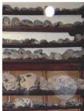
FOTO SIGUIENTE, DOBLE ORB