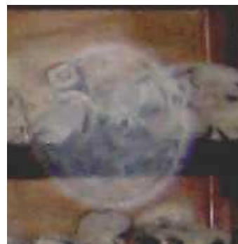
DETALLE AMPLIADO ORB