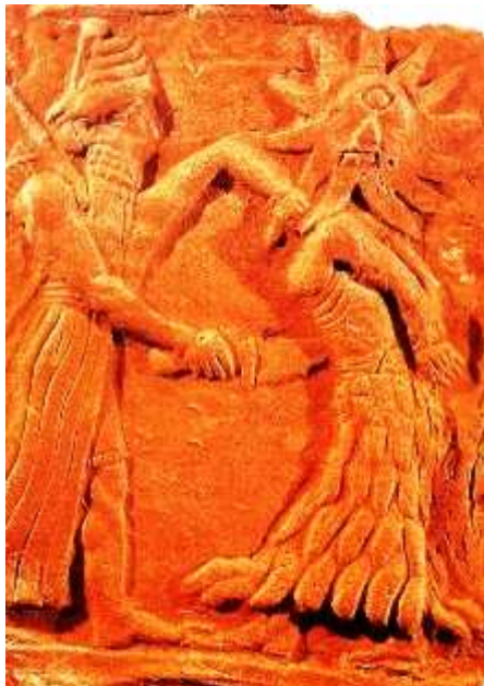
TABLILLA MUSEO DE IRAK