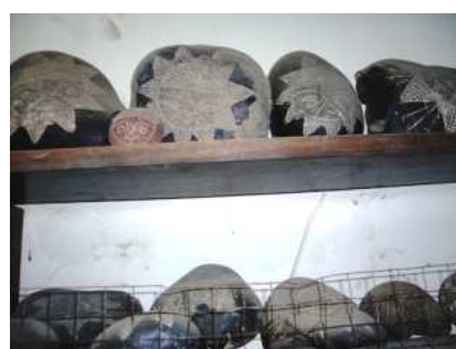
PIEDRAS DE ICA REPRESENTANDO ENERGIAS –ORBS