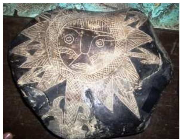
PIEDRA DE ICA – MUSEO CABRERA

Es curioso el enorme parecido del grabado sumerio con la Piedra de ICA, realmente me hace pensar que han existido formas de vida en estado de Energía o mixtos de cuerpo físico-