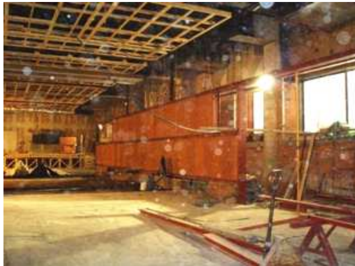
FOTO DE INTERIOR DE EDIFICIO EN CONSTRUCCION

DETALLE DE MOTAS DE POLVO EN FOTO DIGITAL