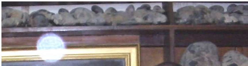
DETALLE DE ORB