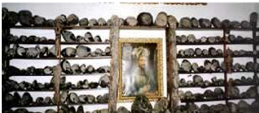
VISTA GENERAL DE LA SALA DE DIOSSES-SOL (MUSEO CABRERA)

http://www.mantra.com.ar/cielointerior/merkabah.html