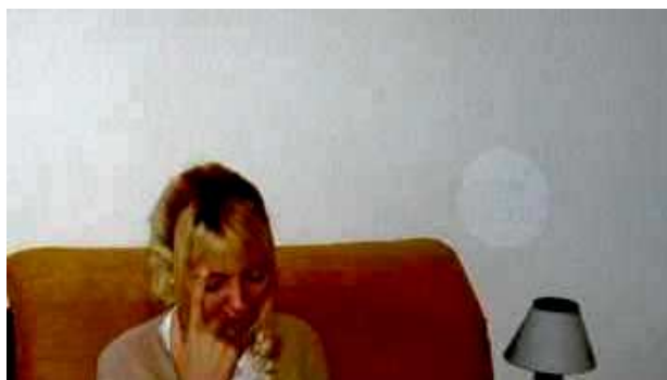
ORBS DURANTE LA MEDITACIÓN