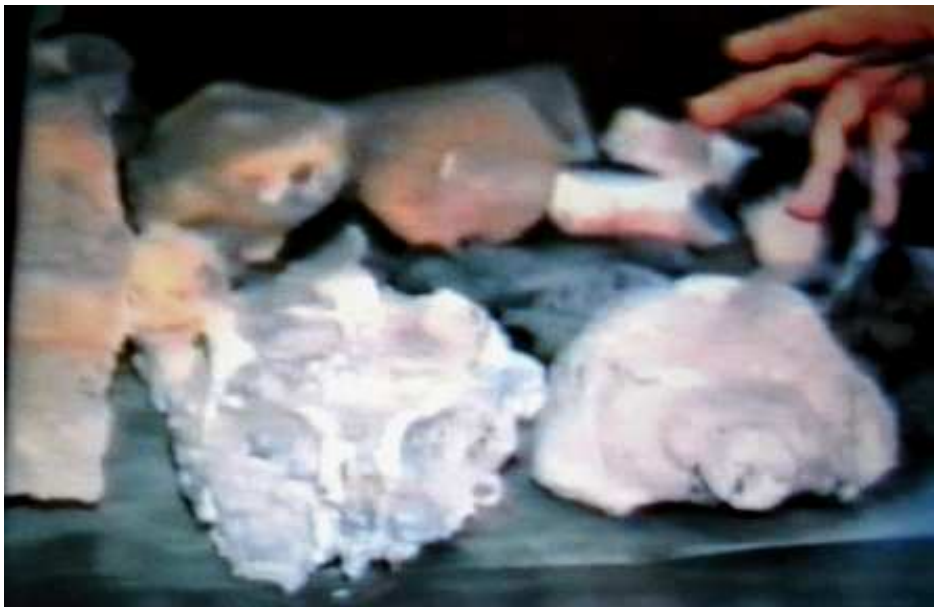
CABEZA Y CEREBRO, FOSILIZADOS DE DINOSAURIO