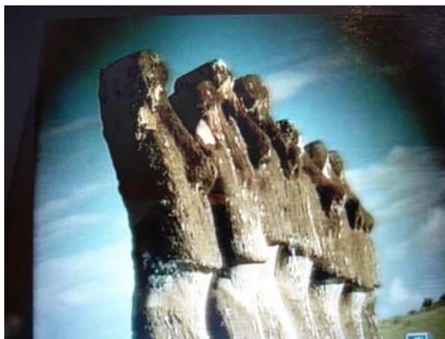
MOAIS DE LA ISLA DE PASCUA