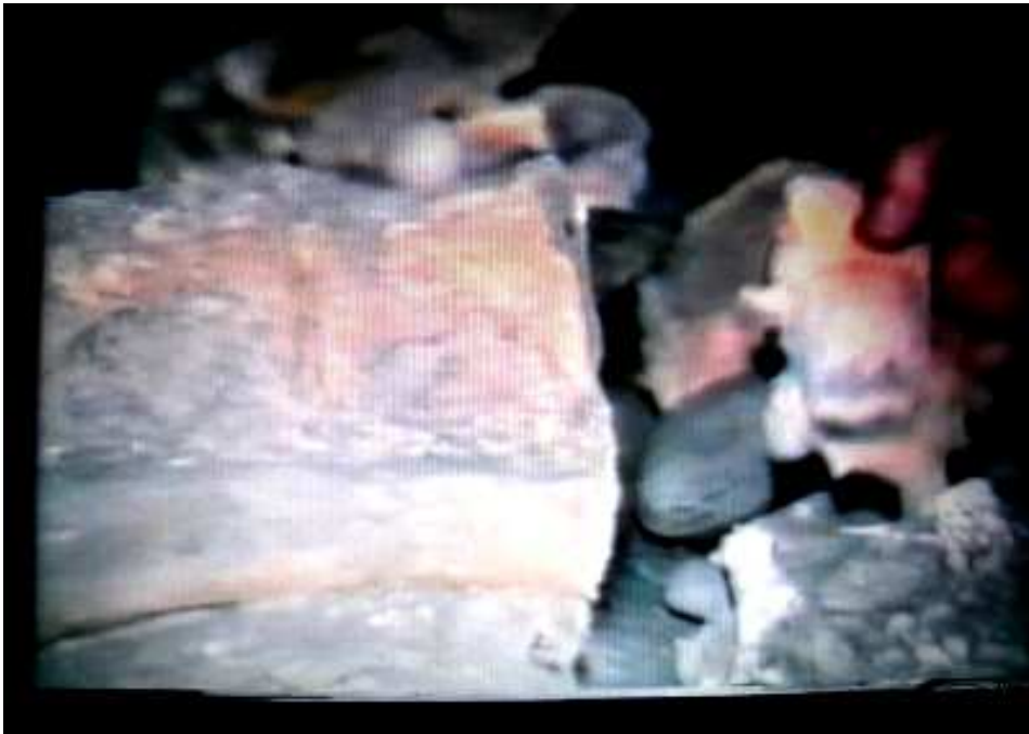
COSTILLA DE DINOSAURIO Y VERTEBRA LUMBAR HUMANA FOSILIZADAS