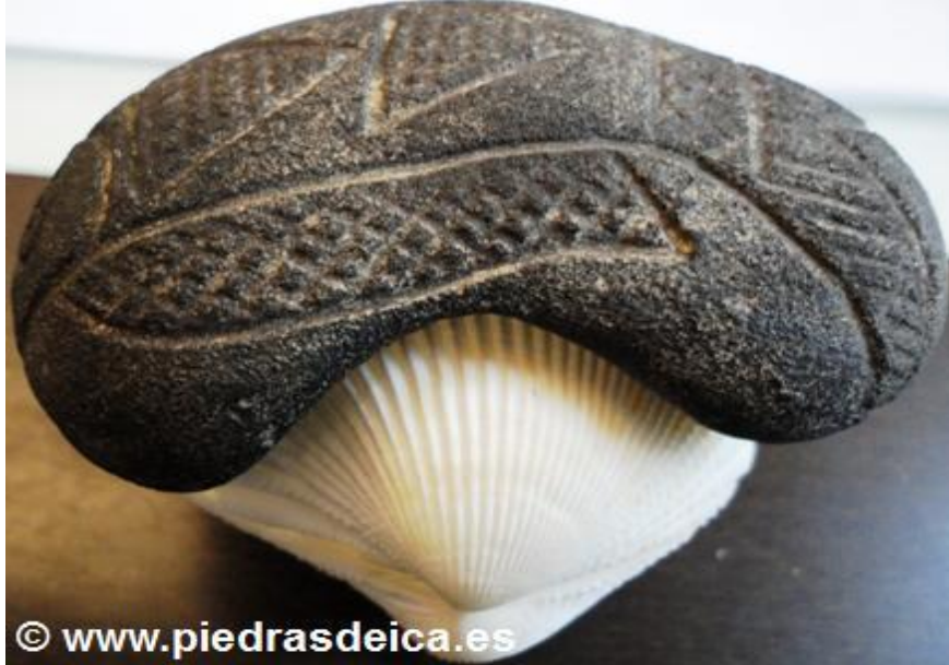
PIEDRA FOSIL SOBREPUESTA EN CONCHA VIVALBA

Que los pseudo-investigadores y detractores, me expliquen, ¡Como se hace una obra de arte tan exquisita!, además, la calidad del grabado supera en mucho los fractales de conchas o bivalvos fósiles de otros moluscos, incluso los elegidos por los libros de Ciencias Naturales o Museos de Biología, generalmente escogidos por estar en mejor estado de conservación.