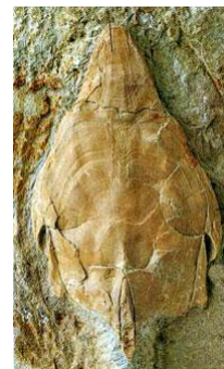
PIEDRAS DE ICA DE AMPHISTIUM O AGNATO Y SUS FOSILIZACIONES