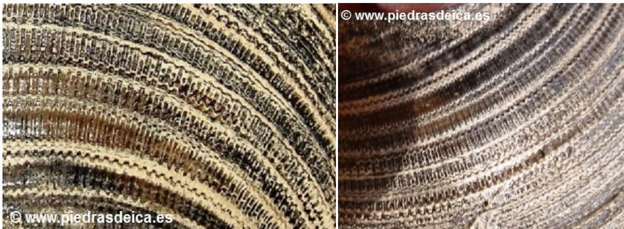
DETALLE AMPLIADO DEL REVERSO FRACTAL DE LA PIEDRA-FOSIL

Al observar el reverso todavía es más desconcertante, si cabe, por sus extrañas formas fractales de compleja belleza, que siguen mareantes secuencias, solo este análisis ya merece un sinfín de comentarios. Pero si, además, resulta que es el “negativo” en Piedra de un bivalvo de surcos transversales, que presuntamente le hizo de “molde”, parecido a la técnica que usan los escultores para hacer sus estatuas, especialmente en bronce. ¡Esto ya se sale de contexto!