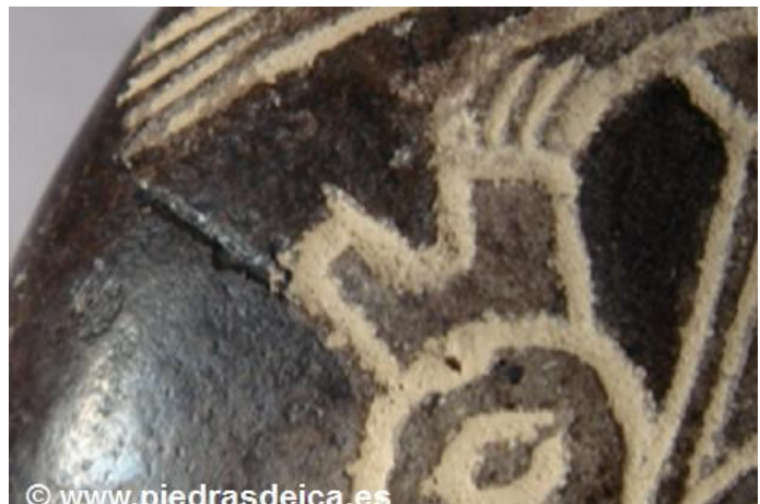
FOTOS DE ENTRADAS Y SALIDAS EN LOS SURCOS DE LOS GRABADOS

No conozco Piedras de características tan singulares como esta Piedra-Fósil pero, intentando hacer memoria, me vino a la memoria el hecho de que suelen grabarse tríadas de Piedras, al menos de las series conocidas, así que de pronto, recordé haber visto alguna parecida en mis archivos, y por supuesto apareció la foto de una Piedra similar, como vemos en la foto inferior, de un importante coleccionista de Perú.