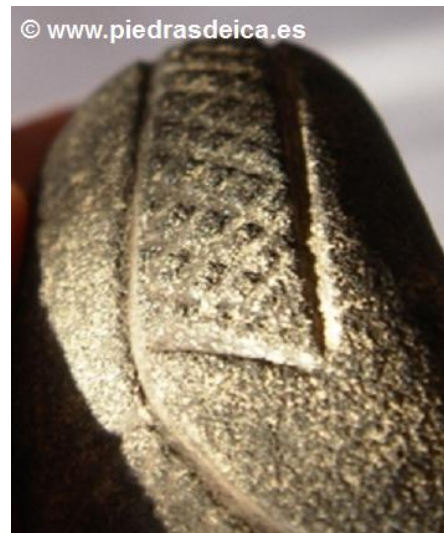
DETALLE ACANALADO DE SURCOS EN PIEDRA FOSIL-AGNATO

Otro nuevo detalle, que no recuerdo haberlo explicado anteriormente, es el hecho de que en algunas Piedras se observa en un extremo, como una especie de “entrada-salida” de inicio-final de los grabados, tipo “plotter”, muy parecido a la ejecución de planos por ordenador que se usa en Arquitectura o Ingeniería, donde los dibujos suelen ser de un solo trazo, similar a los grabados de los Crop Circles.