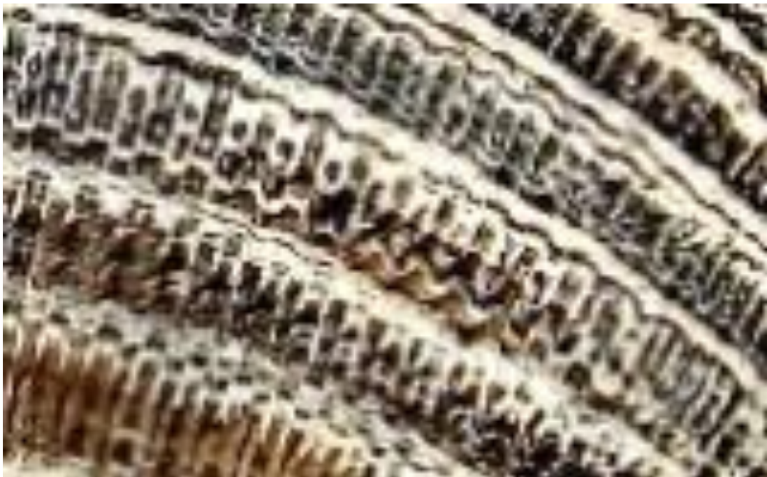
DETALLE AMPLIADO DE FRACTALES

En primer lugar observamos que esta extraordinaria Piedra tiene su cara convexa adaptada a la valva de un fósil, ya que solo así podría entenderse tan extraña forma, además la masa previa a la ejecución de los grabados, tenía que estar en estado “blando”, muy plástico y muy rico en silicatos, para que se adaptara a las formas de la valva y quedar perfectamente incrustados, con una resolución casi tridimensional de todos los minuciosos detalles fractales de la concha, como vemos secuencialmente en los surcos y se aprecia en los detalles ampliados de la foto.