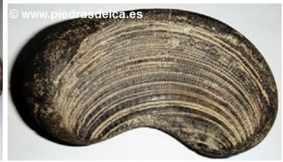
PIEDRA AGNATO-FOSIL Y DETALLES DE FRACTALES.